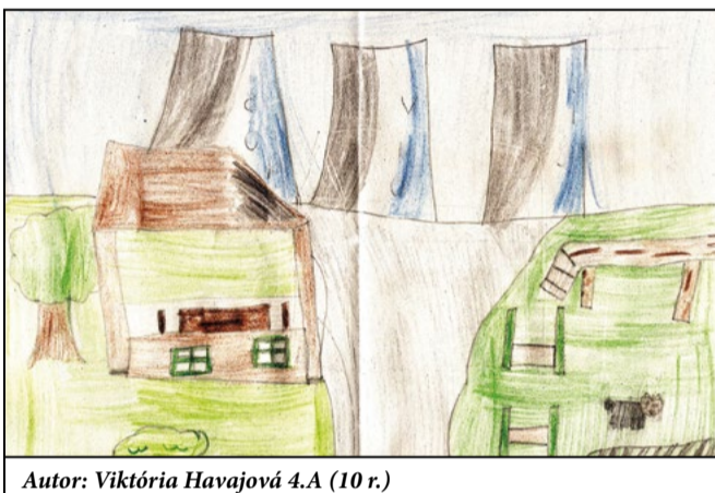
Autor: Viktória Havajová 4.A (10 r.)

ce na víťazstvo má každé dielko, do ktorého autor vloží svoje srdiečko. Štatút súťažnej práce zís-